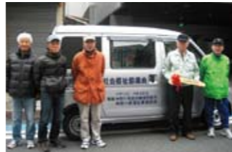
▶新車両と送迎ボランティアのみなさん

パチンコ・パチスロの神奈川県川遊技場協同組合・神奈川県福祉事業協会様より、車椅子で利用できる送迎車両(ダイハツ・ハイゼットカーゴ)を寄贈していただきました。3月23日、これまで長い間活躍してもらった「大魔神号」とお別れし、めでたく納車となりました。新しい車での送迎に、ボランティア・職員一同、とても楽しみにしています。どうもありがとうございました。