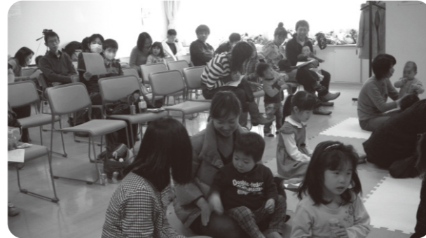
▲ファミリーコンサート

地域の中で子どもを預け、預かりあい、住民同士が子育てをサポートしていくのが横浜子育てサポートシステム。子どもを預かってほしい人と、子どもを預かる人に会員登録をしていただき、条件の合う近隣の方との出会いをサポートします。