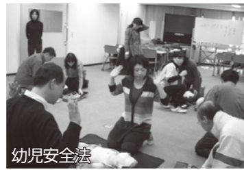
【子育てサポートシステム問合せ先】 鶴見区社協 電話：504-5619