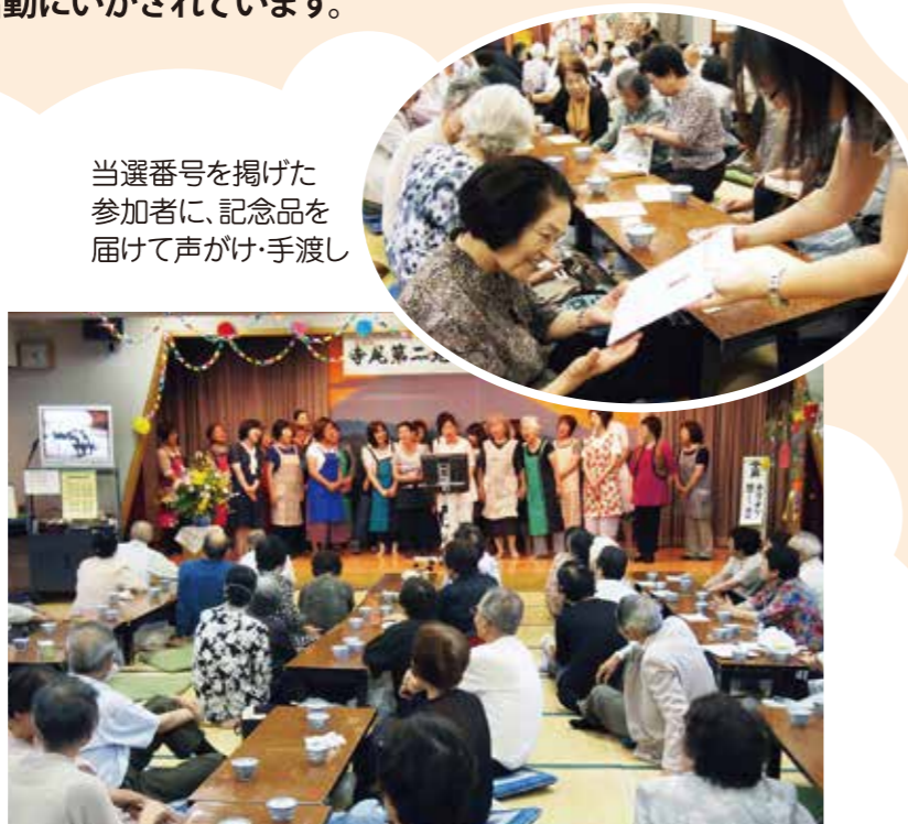
当選番号を掲げた参加者に、記念品を届けて声がけ・手渡し

地域の人たちのおもてなしの心に、参加するお年寄りの笑顔がこたえる「おたのしみ福祉大会」。第16回目の今年も楽しい時間があったという間に過ぎていきました。募金は、昼食の材料購入や記念品などにもいかされています。