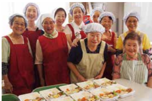
手を止めてカメラに収まってくれた火曜日のメンバー