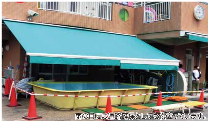
雨の日には通路確保としても役立っています。