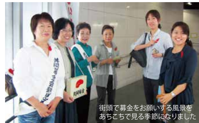
街頭で募金をお願いする風景をあちこちで見ると季節になりました

24年度、みなさんから寄せられた寄付金の総額は2699万70円(赤い羽根共同募金2040万1320円+年末たすけあい募金658万8750円)でした。このうち、自治会・町内会などを通じてお願いした「戸別募金」は2563万1257円で約95%を占めます。区民のみなさんの気持ちが大きな支えになっているのが鶴見区の特徴です。