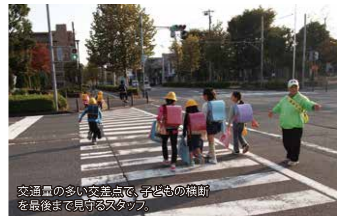
交通量の多い交差点で、子どもの横断を最後まで見守るスタッフ。