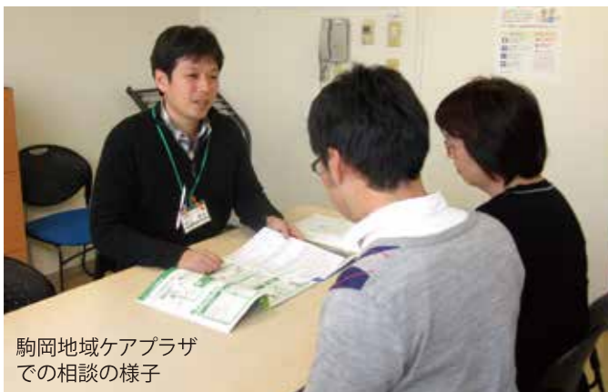
駒岡地域ケアプラザでの相談の様子

地域の身近な相談窓口として、お住まいの地域のケアプラザに設置されています。高齢者が住み慣れた地域で生活を続けられるよう、介護保険やその他のサービスを上手に利用するための様々な支援を行います。