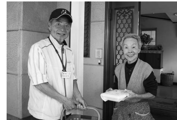
ランチさるびあが作る60食前後のお弁当を、サークル鶴の恩返しのボランティアが手分けして利用者の方々へ届けます