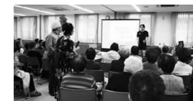
この日は転倒防止につながる「はまちゃん体操」と、認知症を理解するための寸劇が行われました