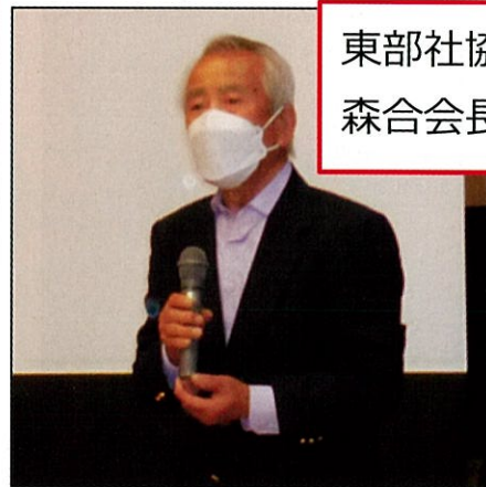
東部社協 森合会長挨拶

今年度の地区フォーラムは3回を予定していますが、残り2回の地区フォーラムで今回のアンケートを分析し、問題点の対策を話し合っていきます。