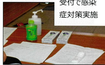
受付で感染症 対策実施