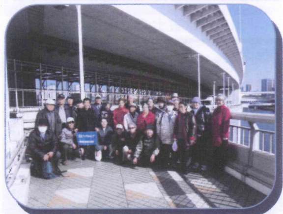
レインボーブリッジ遊歩道