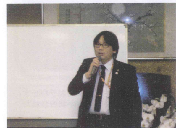
山中行政書士のお話し