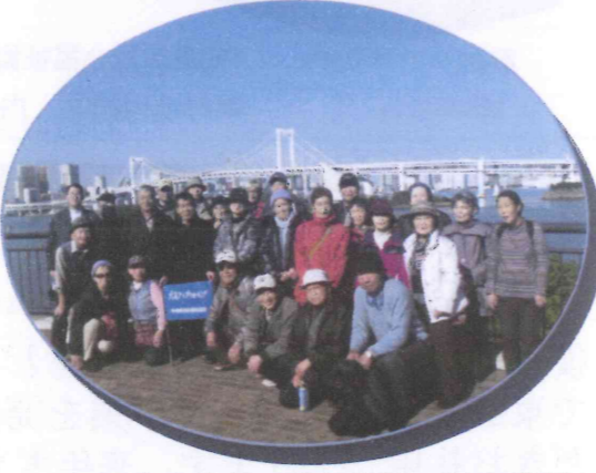
レインボーブリッジを背景で記念撮影