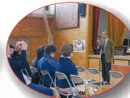
永井会長のあいさつ