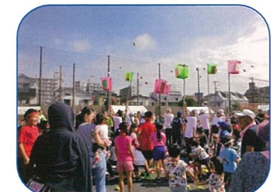
みんなで協力してがんばれー