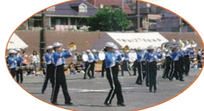
(潮田中学校マーチングバンド部)