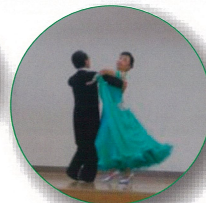
社交ダンス(長谷川会長ご夫妻)