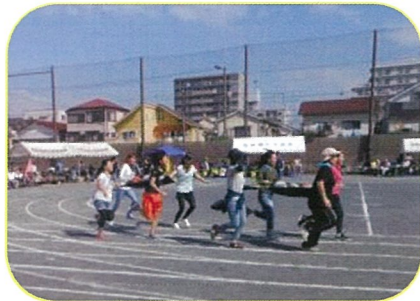
足もと気をつけて