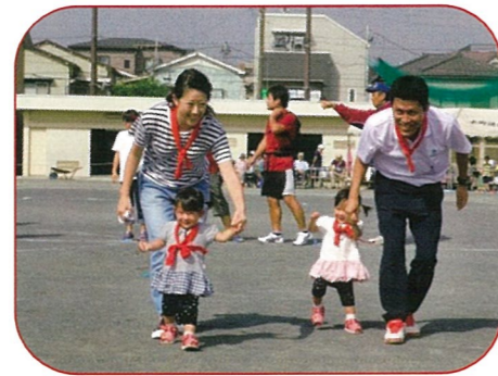
可愛い双子ちゃん！