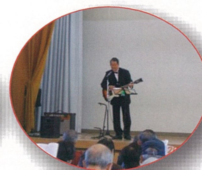
仁科事務局長の歌