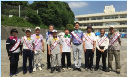
区長さん、会長さんの素敵な笑顔！

椅子をそっとひいてくれたり、立ち上がるのに手を添えてくれたり、笑顔を向けてお客さまをやさしく、温かくもてなそうという気持ちが伝わってきて嬉しかったです。ありがとうございました。