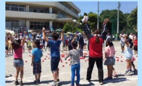
綱引き、玉入れ 優勝だー＼(^o^)/