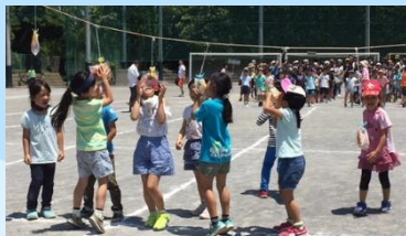
パン食い競争 なかなか取れないね～