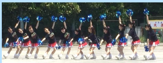
東高校チアダンス部の皆さま 息もピッタリ！素晴らしいです