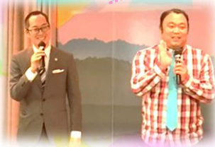
漫才 キラーコンテンツ

昼食後は、福引き・プレゼントで盛り上がり、素敵な賞をいただいた後は、みんなで懐かしい歌を唄いました。最後は簡単な手話を練習し、ご招待者とスタッフ全員で手話による「ふるさと」を合唱して締めくくりました。大きな拍手とともに、来年またお会いできることをお約束し、会は終了しました。