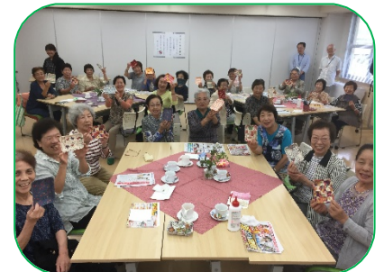
おしゃれ小物の作成も