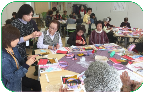
素敵なひな人形ができました

主に高齢の方々の憩いの場の先駆けとして2015年6月にオープンした“サロンせせらぎ”も今年度で5年目を迎え、毎回おおぜいの方が参加されています。昨年からは、地域のいろいろな所で開かれているサロンや地域カフェにも多くの方が訪れ、その相乗効果もあり、その活動はますます広がりをみせています。