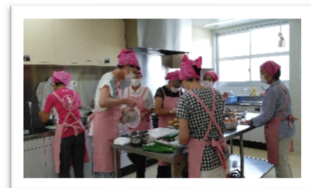
心を込めて調理中