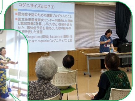
認知症予防に体操を