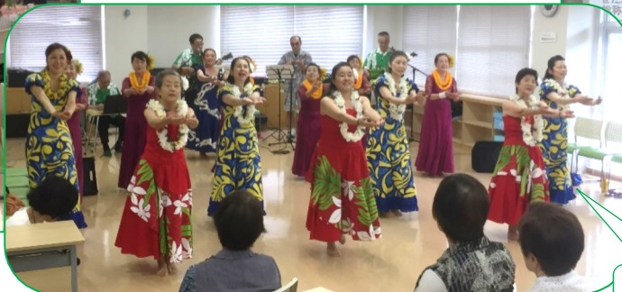
毎年のお楽しみ！ ハワイアンバンドとフラダンス