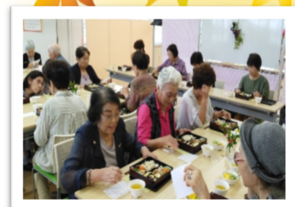
美味しく頂きました♡