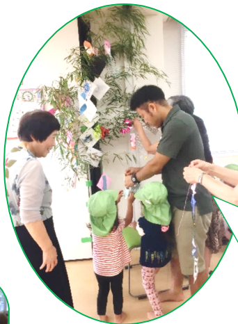
七夕飾りを どろんこ保育園の 園児さんたちと！