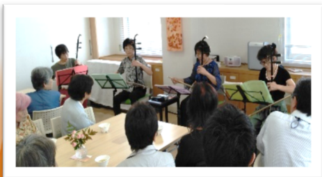
二胡の演奏 素敵な音色でした