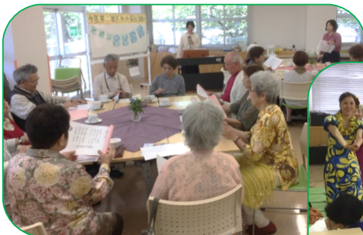
大人気の歌声喫茶 素敵なトークとともに