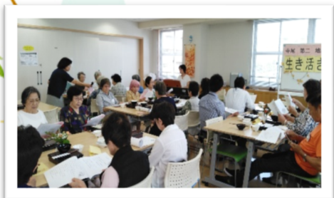
食後はピアノ伴奏で みんなで歌唱