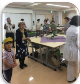
サロン開所当時から大人気のハワイアンバンド演奏