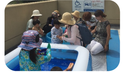
7月は外でプール遊び 疲れたお子さんは、お部屋でも 遊べます

2020年度からは 親子の居場所を“バンビ”に 統合します 多くの皆さまに、安心して楽 しく過ごして頂けますよう スタッフ一同頑張ります✿