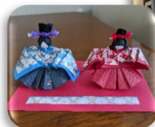
お雛様づくり 親王飾りができました