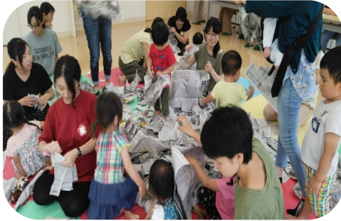
新聞紙を思いっきりビリビリ~!

2020年度からは 親子の居場所を“バンビ”に 統合します 多くの皆さまに、安心して楽 しく過ごして頂けますよう スタッフ一同頑張ります✿