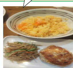
にんじんご飯と一緒に 試作しました♪