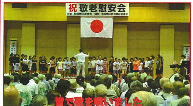
皆で歌を唄いました