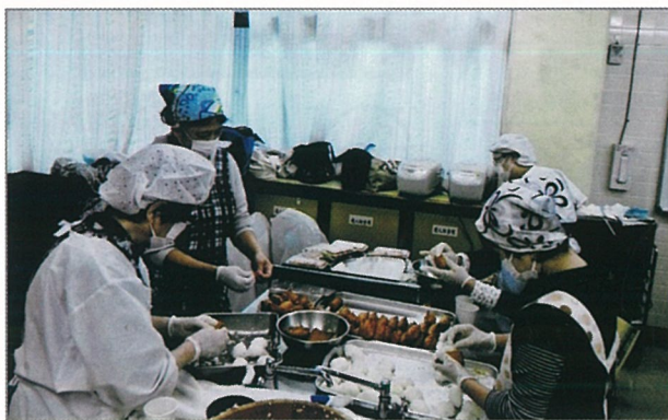
皆さんの協力・努力で作られた1800個のいなり