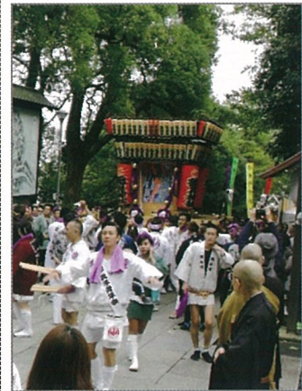
地元の木遣りが先導し、みこし2基が練り歩いた参道