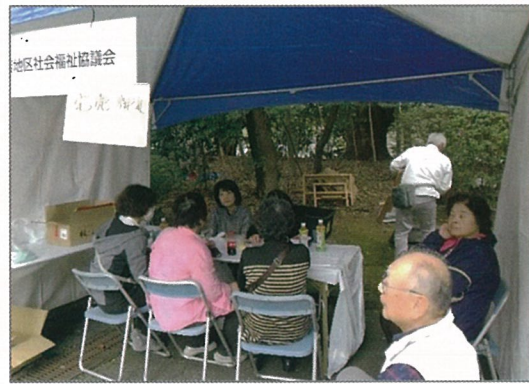
早くも完売。ホット一息

今年は天候不順で災害の多い年でした。 来年の令和2年は平和な年でありますように！ 良い年をお迎えください。