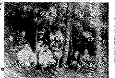
昭和9年発掘調査の際